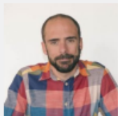
Imagen de perfil

Puedes cambiar la imagen de tu perfil en Gravatar.